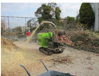
樹木粉砕機による木材チップの作成