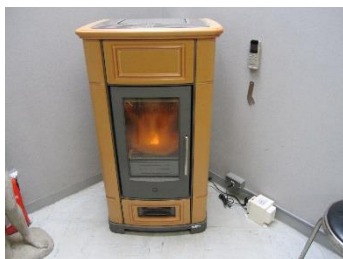
講義室に設置され運転中のペレットストーブ

このようにして作成した木質ペレット燃料に用いて、管理棟の1階の講義室、展示ホールおよび2階の共通実験実習室に設置されたペレットストーブによって各部屋の暖房を行います。