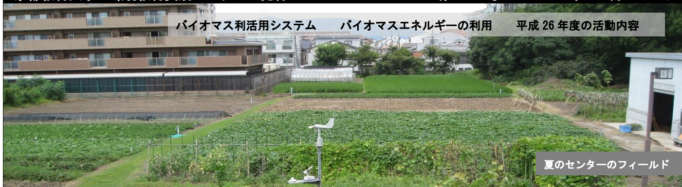
夏のセンターのフィールド