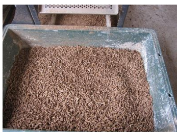
作成された木質ペレット燃料