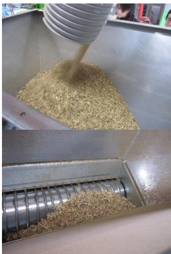
木材チップの投入