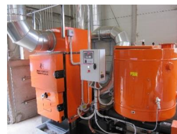
木材チップを燃料とする温風ボイラー

樹木粉砕機によって作成された木材チップは含水率が高いため、攪拌機に入れ、木材チップを燃料とするボイラーからの温風によって、攪拌しながら乾燥させ、木材チップの含水率を10%～15%程度に低下させます。