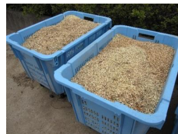
粉砕機で作成した木材チップ