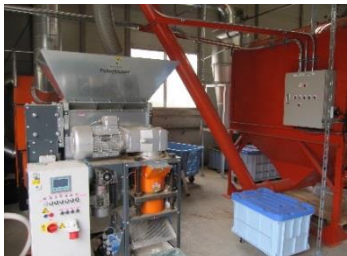
攪拌機内で十分に乾燥した木材チップのスクリーコンベアによる木質ペレット作成機への投入

下した木材チップを木質ペレット成型機により木質ペレットを成型して、木質ペレット燃料を作成します。