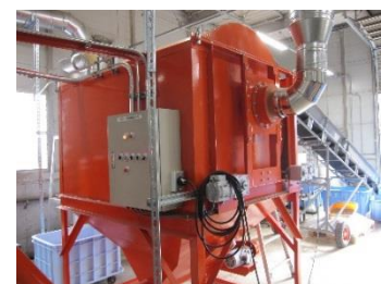
木材チップ攪拌機