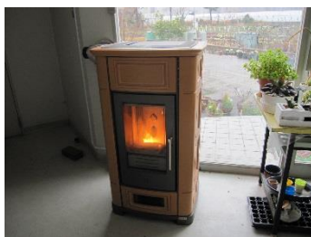
展示ホールに設置され運転中のペレットストーブ